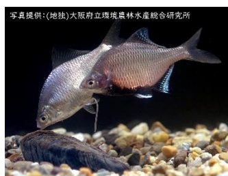
↑イタセンパラ（天然記念物） 東海地方と近畿地方の一部に分布