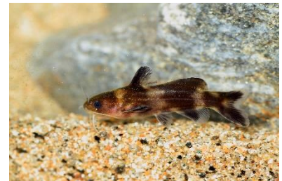
↑ネコギギ（天然記念物） 東海地方の限られた川にのみ分布