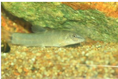
↑アユモドキ（天然記念物） 近畿地方と中国地方の一部に分布